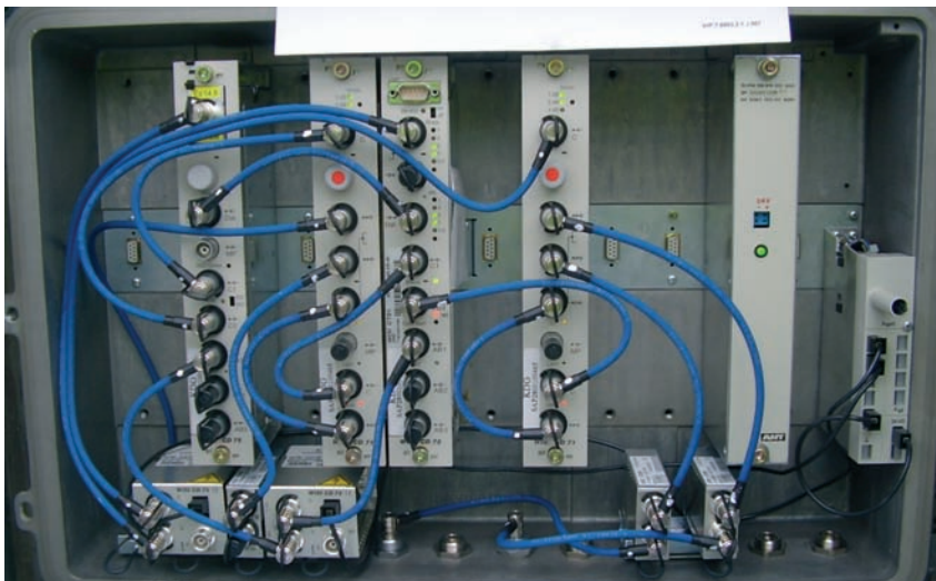
Verstärkerpunkt nach der Umrüstung mit WISI Modulen

Auf koaxialer Ebene muss außerdem, so Kunze, die gesamte Verstärkertechnik ersetzt werden. Dazu müssen alle Verstärkerpunkte (VrP), die sich in KVz (Kabelverzweigerkästen) befinden, angefahren werden. Diese grauen Kästen