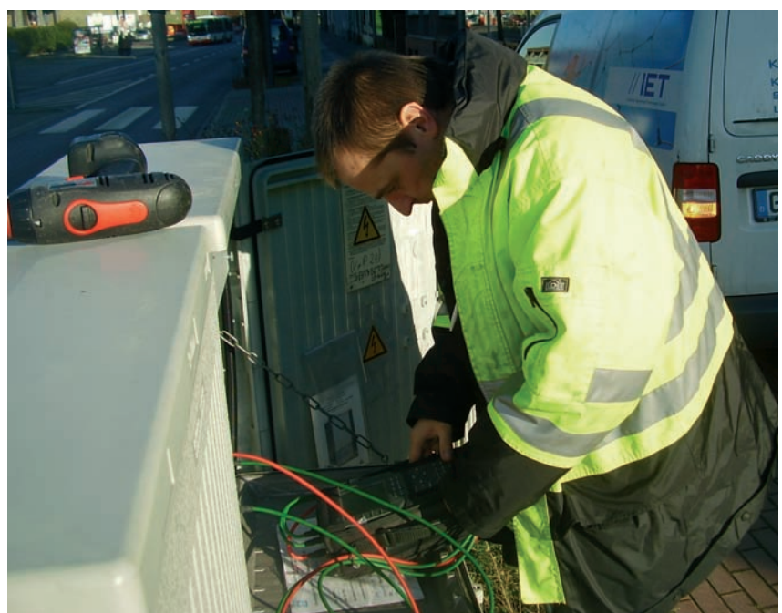
IET-Messtechniker beim Einmessen mit dem Stealth Feldmessgerät SDA 5000